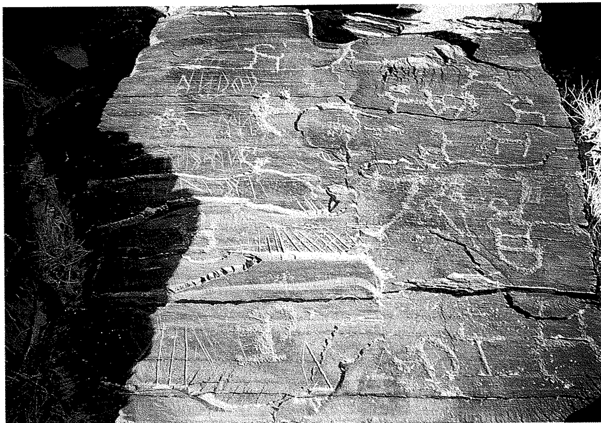
9. Del uul yazıtı: II.