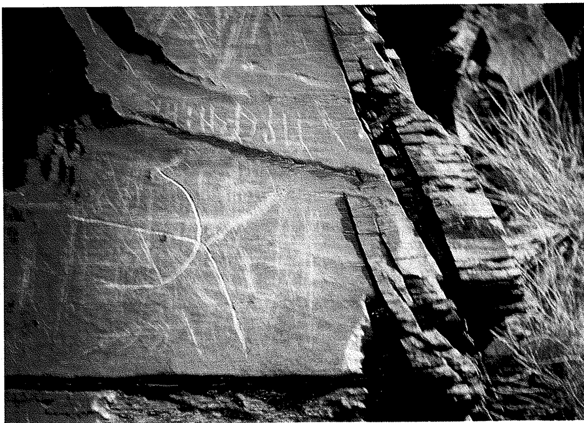
10. Del uul yazıtı: III.