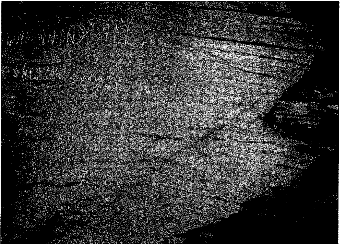
11. Del uul yazıtı: IV.