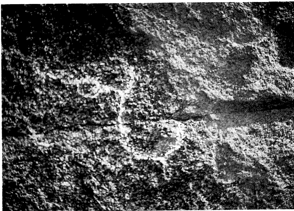
12. Ъᠡ бᠢᠴᠢᠭᠲᠤ ᠶ᠋ᠵᠢᠨ: