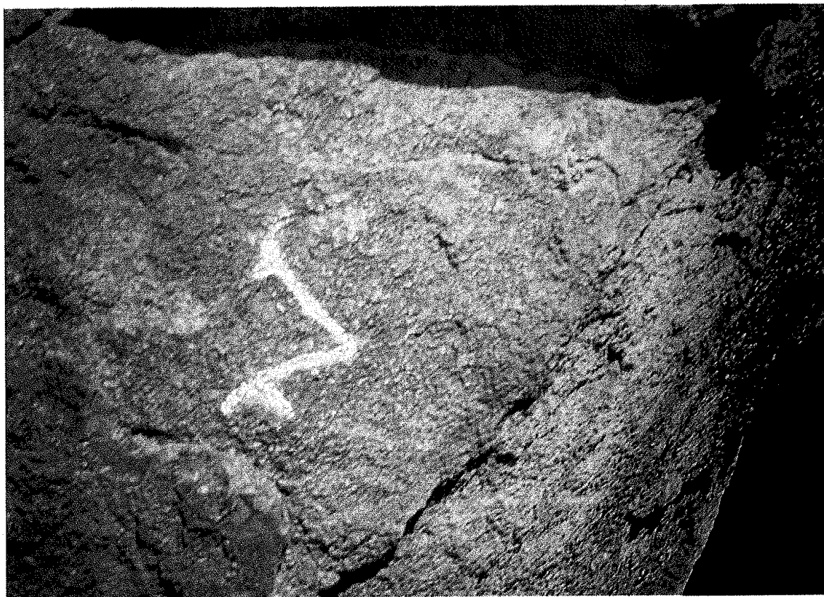
12. 1ᠡ biᠴigt yazıtı: