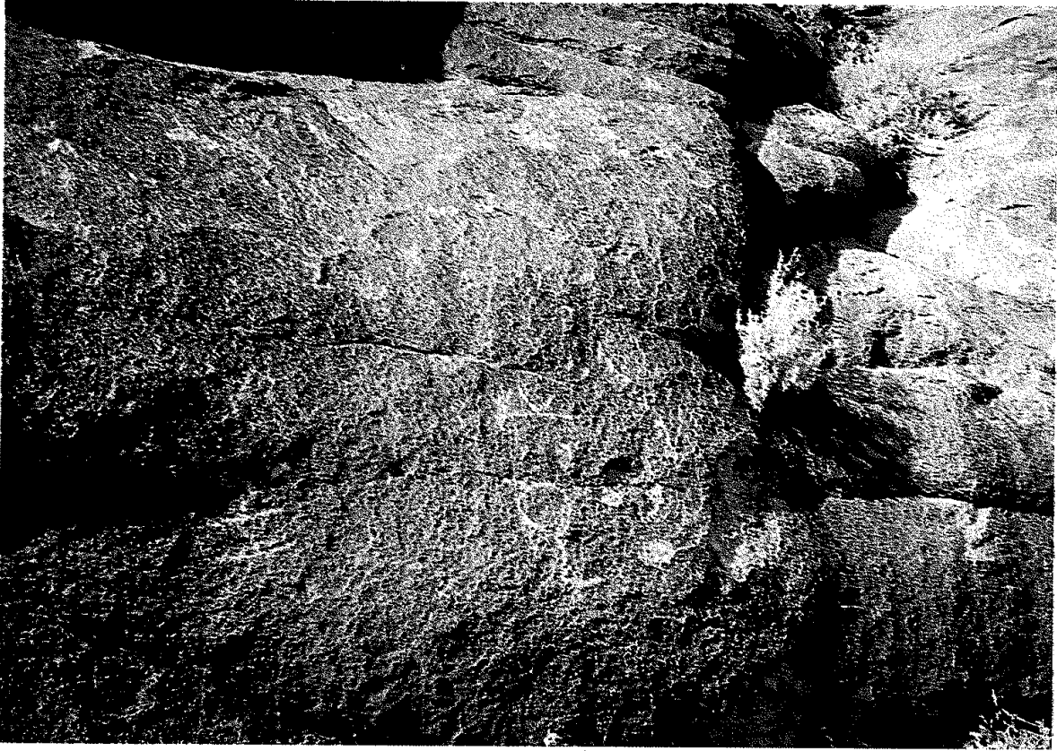
12. İh biçigt yazıtı: