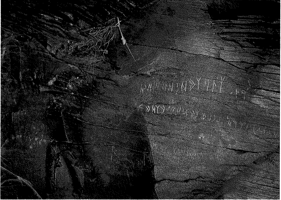
11. Del uul yazıtı: IV.