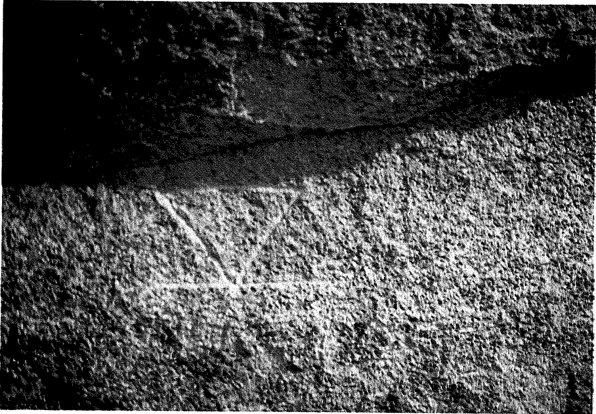
12. İh biçigt yazıtı: